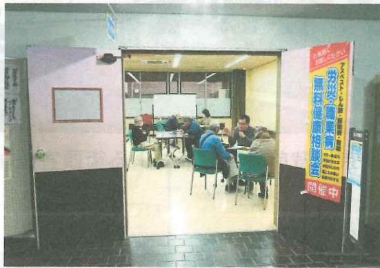
羽島市での健康相談会の様子

聞やチラシを持参してみえま した。これからも複数の方法 で、相談会の開催を周知して いきます。