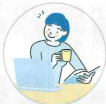
集中力・判断力の向上