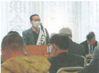
報告集会で報告する広沢原告

原告がいのちあるうちに早期に解決していたかどうかお願いいたします」と意見陳述をおこないました。