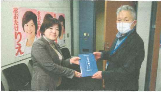
大嶽議員に本を手渡す角田原告