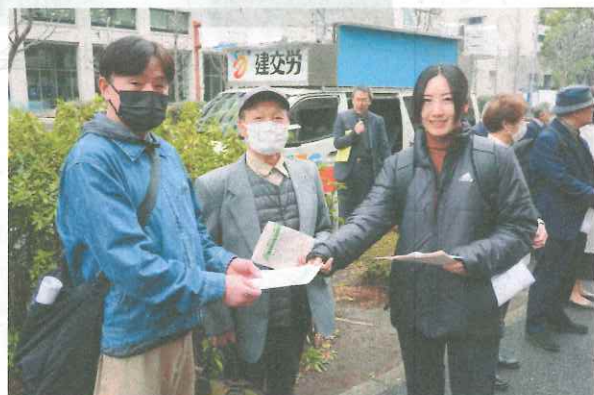
地裁前でビラ宣伝

弁論終了後は報告集会を開催。第8陣訴訟の早期解決と基金制度の実現に向け奮闘することを意思統一しました。