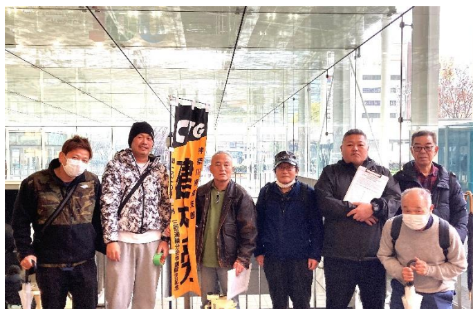
3.16JR川崎駅前宣伝行動に参加した県南支部の仲間

ところが、当日の行動準備の段階になって肝心の宣伝物が随分と少ないことに気づきました。という訳でせっかく