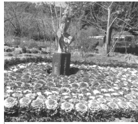
麦わら帽子の少女

料200円、観覧温室入室料200円ですが、敬老乗車証を見せてフリーパスで入れました。最初に目に入ったのが、ハボタンの花壇と「麦わら帽子の少女」の像。定期的に春に咲く多くの花は「養成中」が多かったですが、しばらく歩くと人がたむろしてカメラを構えています。