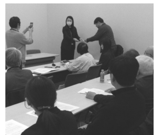
統一要望書の提出

答を引き出し、次の闘いに道を付けるものにしよう、と呼びかけました。報告後に7つの支部・部会から決意表明。親会社から大幅賃上げに圧力がかかる中でも、続けてきた労使協議を力に早期回答を得たことや、徹底して組合員の要求を引き出して交渉を行い、闘いのなかで組合員拡大を取り組んでいることなどが報告されました。