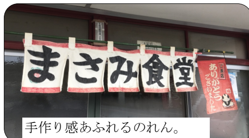
手作り感あふれるのれん。