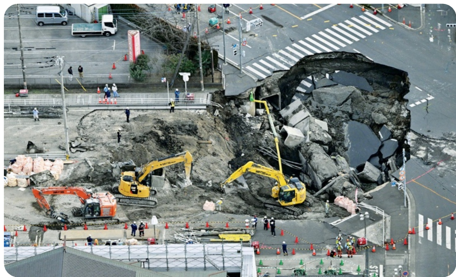
陥没した埼玉県八潮市の現場。運転手の捜索が続けられています。

埼玉県八潮市で発生した道路陥没事故。近隣の生コン工場、ストックヤードなどに入入りする組合員も少なくありません。組合員が事故に遭遇していた可能性は否定できません。再発防止の観点から、あらためてインフラ老朽化対策に取り組むことが求められています。