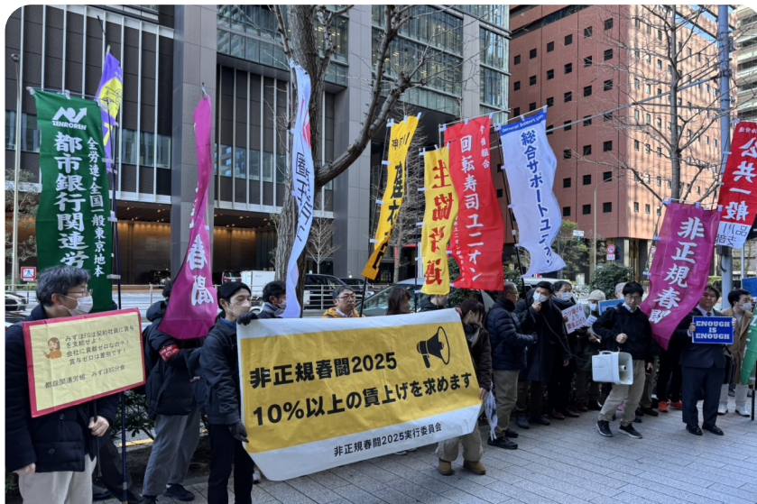
2月5日ヤマト運輸本社前で「非正規春闘」建交労から要求書提出。

非正規雇用で働く人は国内で2100万人あまりと、労働者全体の36.8%を占めています。「非正規春闘」の取り組みは今年で3年目です。今年28の労働組約4万人が参加し、一律10%以上の賃上げを求めて117社に要求書を提出しました。建交労はヤマト運輸に非正規の大幅賃上げ、団交開催などを求めました。