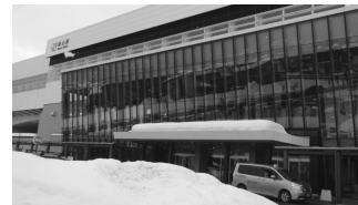
北陸新幹線・飯山駅

京都駅から朝、サンダーバードと北陸新幹線を乗り継いで飯山駅、さらにバスで野沢温泉村へ。途中から周りは真っ白の銀世界。「ごんにむ荘」とい