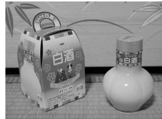
宝酒造・ももやま白酒

ただ「白酒」 には興味津々 で、買って飲んでみたが、あんまり 旨いもんやなかったなあ。