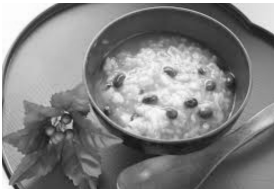
1月15日は「小正月」小豆粥