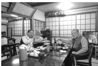
ごんにむ荘の夕食

最終日は朝から帰り支度をして、京都駅着が3時過ぎ。無事怪我もなく帰れて、お互いに安堵して別れた。