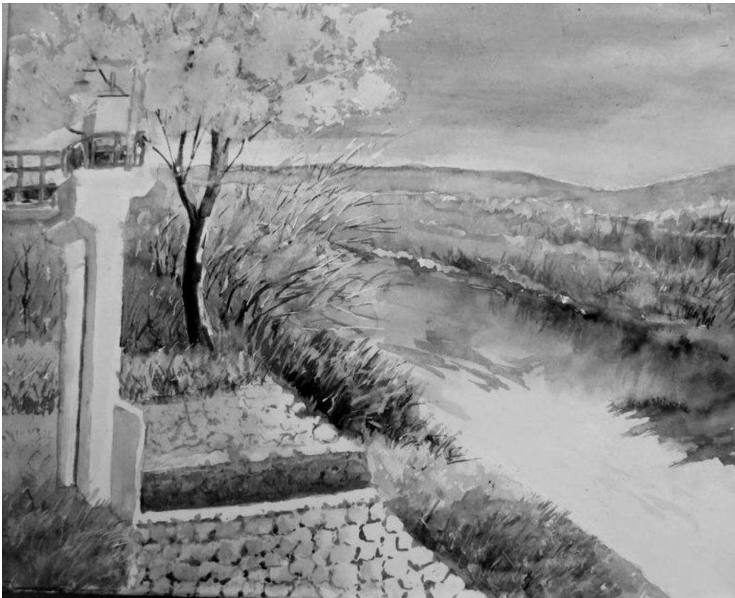
大きな宇治川の冬

全日本建設交運一般労働組合 (建交労) 京都 事業団・高齢者部会 〒601-8103 京都市南区上鳥羽仏現寺町43番地 Tel 075-691-1007 Fax 671-1641 Eメール kenkourou@titan.ocn.ne.jp 発行日 毎月15日 一部30円 No.347 (2025年) 2月号