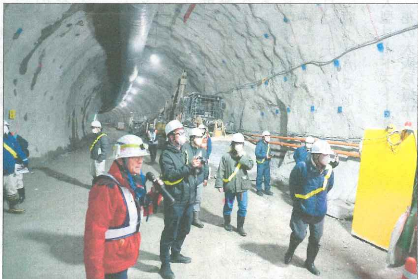
施工責任者から説明を受ける建交労調査団