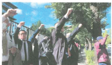
厚労省前でシュプレヒコール