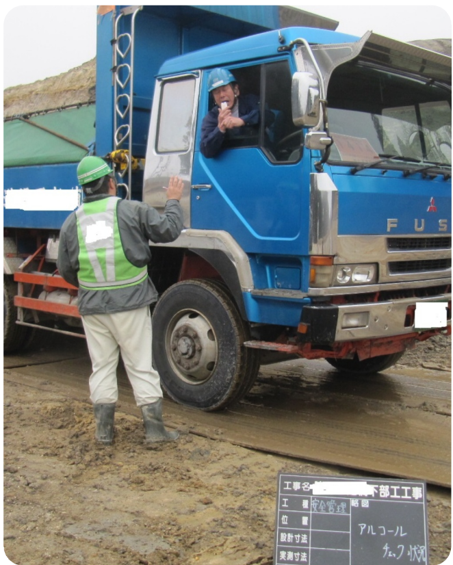
白ナンバーも自動車5台以上使用する安全運転管理者はアルコールチェックの実施、記録、保存が義務。

深夜から運転業務を開始する組合員が少なくありません。早い時間に寝るためにアルコールを利用する人もいます。しかし、怖いのは無自覚な残り酒運転です。年齢とともにアルコールの分解能力は落ちてきます。事例をもとにした注意喚起です。