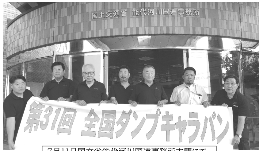
7月11日国交省能代河川国道事務所玄関にて

中小零細企業の多くは大企業の下請であり、指値や買いたたきなどによって不公平な取引にさらされていて、経営的にきびしい状況にあります。中小零細企業が安心して最低賃金引き上げに対応できるよう政府予算を大幅に引き上げるとともに、社会保険料の事業主負担を減免するなどの抜本的支援策が求められています。