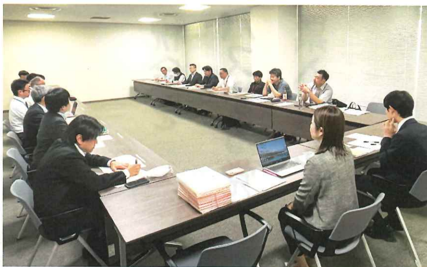
上が全国ダンプ部会幹事会、左右が国交省 5月17日