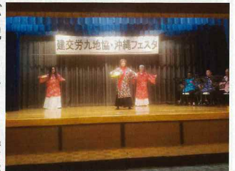
沖縄県の組合員さんによる余興

2日目は朝からバスで、辺野古新基地に視察へ向かいました。バスの中ではガイドさんから辺野古新基地に関する現在の過程状況や沖縄の人の基地移転反対運動の思いなどの話を聞くことができ、辺野古新基地への視察は船からの視察と陸からの視察の2つの班に分かれ、船の手配の関係で10人しか船に乗れないとのことでした。福岡協議会の4名は陸からの視察になり、船で視察に行った人からの話では、海での新基地建設境界線まで近寄ると直ぐに海上保安庁の船が近づいてきて、マイクで注意をされた。境界線の警備は365日毎日、警備の船がいるようで、地元の漁師の方たちも1日5万