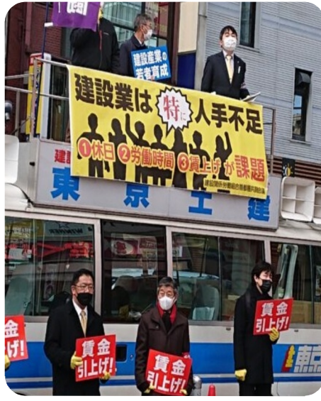
2月都内で建設労組による宣伝行動

建設業界でも、物流業界と同様に4月から時間外労働の上限規制が適用され、人手不足が深刻化する「2024年問題」が懸念されています。 現場で働く労働者の待遇を向上させて人手不足を解消するため6月改正建設業法が成立しました。 改正法では、建設業者に対して労働者の処遇確保を努力義務とし、著しく低い労務費等に よる見積書の作成などが受注者と注文者の双方に禁止され、違反注文者に対しては国土交通大臣等による勧告がされます。また、不当に低い請負代金による原価割れ契約の禁止が受注者に対しても導入されます。しかし、改正法は抜け穴だらけです。国が本気になれば法改正などしなくても待遇改善は可能であり「アリバイづくり」の気配が濃厚です。