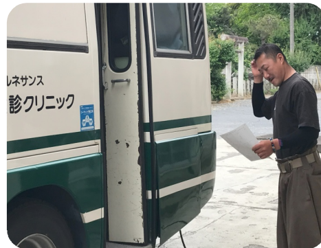
不安そうにレントゲン車に入るKさん。悩みがあるようです。