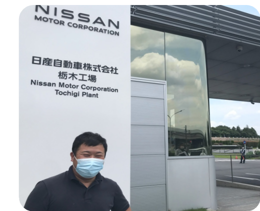
下請けいじめが発覚した世界の日産。