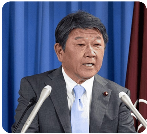
地元選出の茂木敏充自民幹事長 9億7150万円何に使ったんですか？

2022年自民党幹部で最多は地元栃木5区選出の茂木敏充氏にたいする9億7150万円、巨額の資金が何に使われたかまったく不明です。自民党の収入の3分の2は国民の税金である政党助成金です。私たちが地元有権者の見識も問われます。