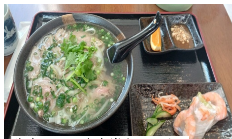
牛肉フォー生春巻きセット

ベトナム料理といえど、米粉でつくった麺(フォー)が有名です。佐野ラーメンのようなコシはまったくありません。スープはあっさり系で大変おいしい。生春巻きセットやベトナム風チャーハンなどもあります。ランチセットはお得でボリュームあります。