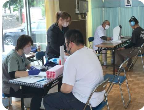
少しやせた方がいいと指摘されるKさん。会場は組合近くの公民館。

組合の検診会は、早期発見・早期治療によつて病気で廃業する組合員を一人でも減らすことを目的に、年2回春・秋の日曜日開催しています。