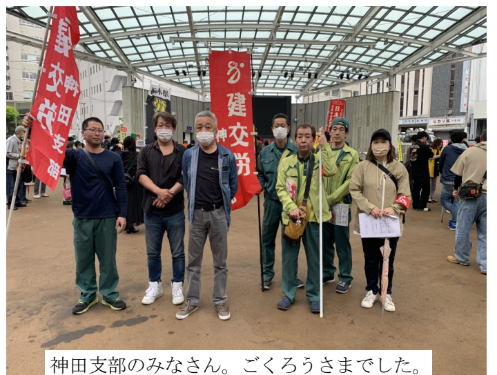
神田支部のみなさん。ごくろうさまでした。