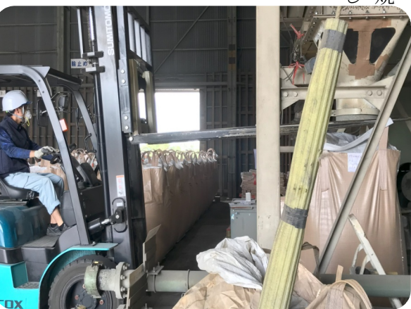
夏は地獄。建屋内でのセメント袋詰め作業。