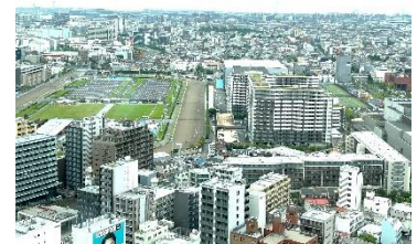
川崎市役所25階からの眺望

13:00からは横浜市への要請を8名の参加者（市側も8名で対応）でおこない、事業団支部は高齢者の雇用・就労機会の拡大・生活困窮者自立支援事業への配慮を求め、ダンプ支部は