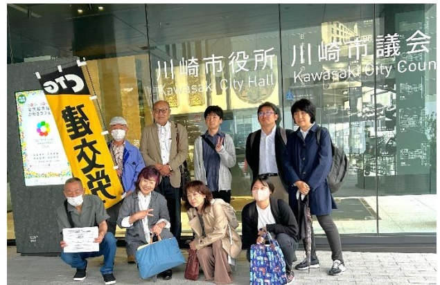
川崎市役所の新庁舎まえて宣伝行動後の集合写真

9:00からの川崎市要請は、参加者11名全員でおこない学童保育指導員支部の5名を中