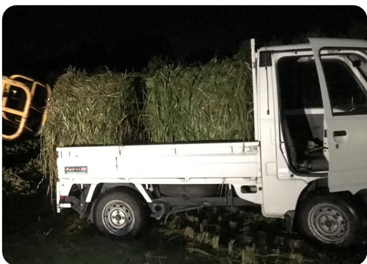
福島県大熊町で牛のエサ運搬に奮闘する「さのボラ号」

しかし、殺処分に反対した酪農家の牛達が現在、原発被災地の農地「さのボラ号」は福島保全、里山復興の貴重に骨を埋める決意です。