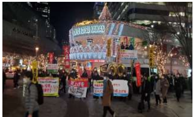
官民共同の宣伝行動(2月15日東京・有楽町)

会社の体力を踏まえて、経営を守り、働き続けられる環境を使用者と協議する場にもなり得ます。全ての組織が春闘に決起できるよう力を尽くしましょう。